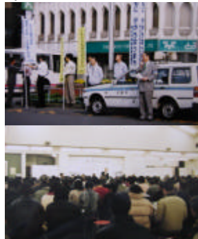
日野市が全庁的に取り組んだ街頭 宣伝(上) 説明会(下)

数値目標の設定と成果の確 認をきちんとおこなうこと 効率化重視策ではなく、減 量優先をおこなうこと(こ