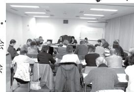
●市民派ネット主催の説明会