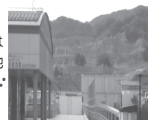
●「彩都西」駅、後方は開工工事中の造成地