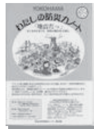
フォーラム南太田(横浜市)は「防災力アップ」を作成し、啓発に努めています。

参画の視点を盛り込み、普段の地域コミュニティのありかたや防災対策を検討する自治体が増えてきました。箕面での取組みを要望し、市の前向きな検討を取付けました。