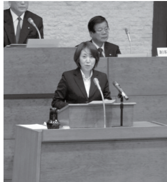
中西は代表質問、討論、一般質問を通して人を大事に支えあう共生のまちづくりを訴えました。

国民健康保険料は2億円値上げ、教育や福祉を削る一方で、開発推進、行政のムダは改善されず!