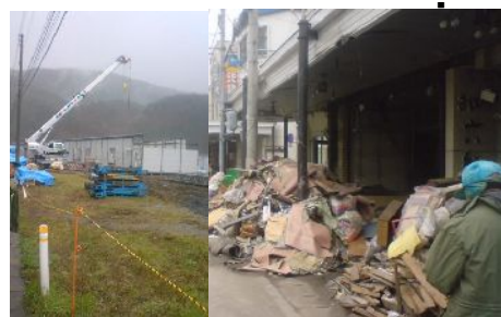
岩手仮設建設現場 釜石商店街の様子(4月下旬ごろ)