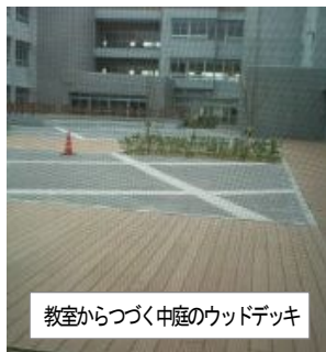
教室からつづく中庭のウッドデッキ

この春から、彩都の施設一体型の小中一貫校が開校し、1年～9年生までの71人が入学。森町の一貫校の成果を検証しないうちに、開発の目玉の「こく、デフックス」なう校目が建設されました。