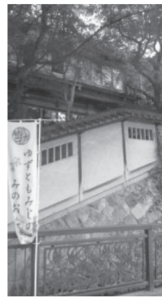
滝道沿いにある旧河鹿荘

将来的に地域住民が施設を運営し、新たな公共の担い手として参画できる可能性すら残さないというのは、土地利用のあり方を含め、目先に捉われ、将来のまちづくりを考えない無責任な政策だといえます。