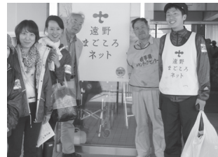
現地で知り合った仲間と

短期間ですが、被災地の復興ボランティアに参加し、津波被害地域の土砂撤去作業を行いました。とにかく現地へ行きたい、何かお手伝いしたい、との一心で駆けつけましたが、やはり現地の惨状は想像以上。復興までの険しさを目の当たりにしました。関西で何ができるのか。被災地の方々に寄り添いながら、できる限りのことをしたい、と改めて決意。7月15日～18日に2回目のボランティアに出かけます。