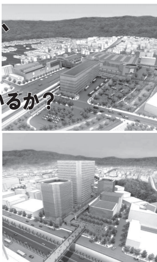
新駅のイメージ/上:新箕面駅、下:新船場駅

鉄道事業者は採算を考慮した80億しか負担せず、不足分は箕面市が被ることに。このような箕面市の想定外の負担について、市民の合意は得られていません。ヘルスケア総合センターに市民会館を併設? 市民不在のまちづくり 船場のまちの検討に、市民は蚊帳の外。萱野周辺の農の緑をどのように残すのか、条例制定などの具体的な案はなし。なお千里中央発着のバス620台が萱野へ。東部、北千里・千里中央間のバスが不便にならないことも課題。