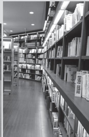
整備費約7500万円。大半は国の交付金を活用というけれど...

Q 中央図書館がリニューアルされたが、①天井までの書架で区切られたため、一般向けスペースは暗く、狭苦しい②書架の上部の棚に手が届かない③ゆったり座れた椅子や読書スペースが減った④新しい本が少なく、本の充実に予算を使うべき表のデスクのドアは車椅子への配慮がない。⑥図書館と飲食コーナーは明確に分けるべきだ。(以上多数のご意見が寄せられました)