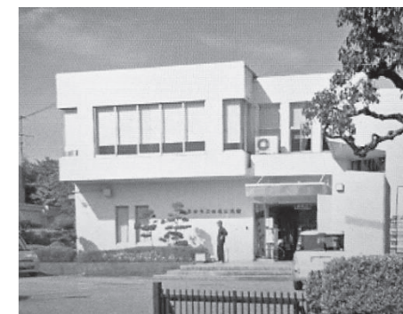
西南公民館・・・箕面市で唯一の公民館。昨年からすったもんだのあげが、現地建て替えに決まった。

ら減免になる、という説明が不足していた」と言い訳にもならない説明で、約束を反故にしました。