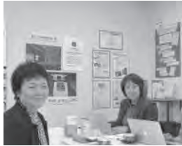
夜は、女性防災リーダー養成のNPO法人イコールネット仙台を視察

*女性の視点を入れた防災対策 *震災後の仙台市のまちづくり と市営地下鉄の整備方針